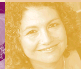
Gestaltung: Hilmer Grafikdesign

Wir danken für die freundliche Unterstützung: